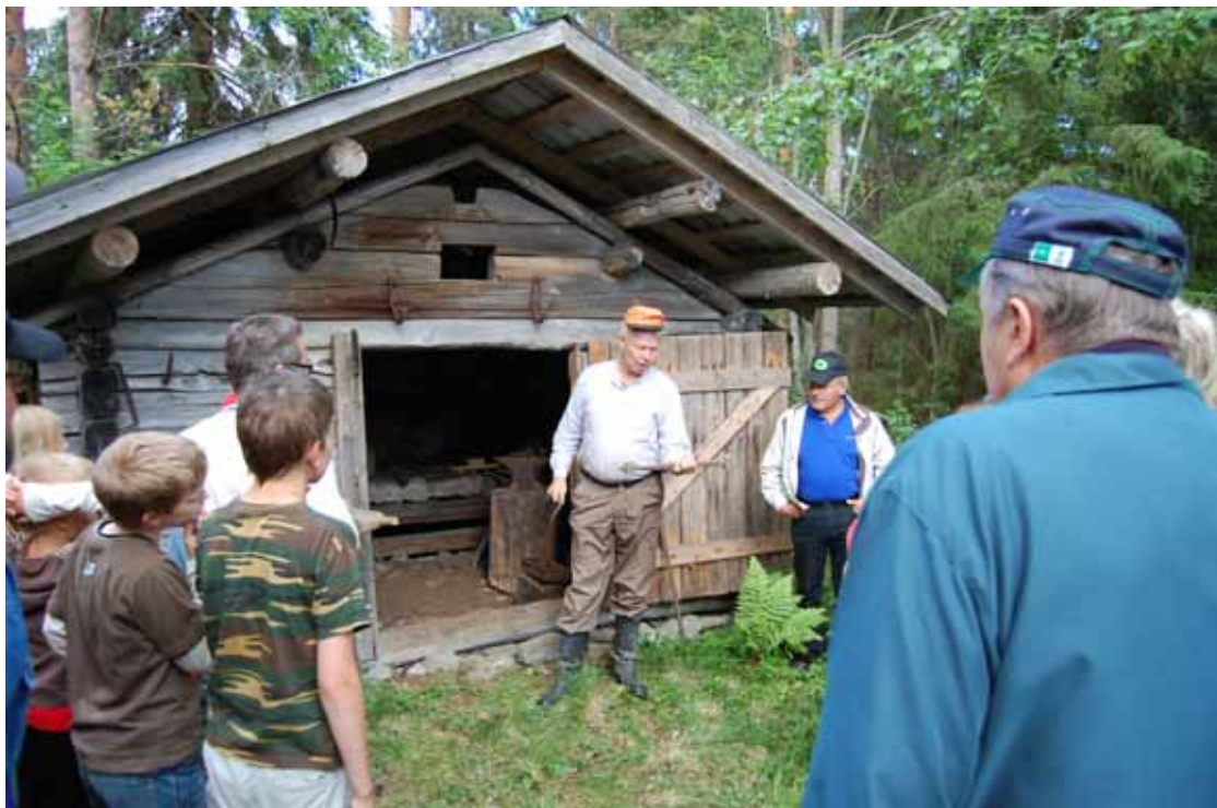
Anton-papan paja kiinnosti. Sen kynnyksellä Tapio kuuli monet hyvät jutut.