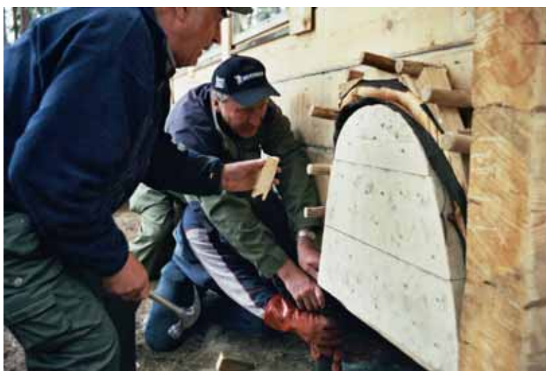
Luokinväntöä työnäytöksessä 2006 Tikkalassa.

Muutkin alueen kyläyhdistykset innostuivat metsäperinteestään: perustimme Metsätorpanmaa ry:n 2006 ja lähdimme pariaksi vuodeksi keräämään metsäperinnettä tarinailloin ym. konstein Suomen Kulttuurirahaston tukemana. Syntyi hieno Metsätorpanmaan Kansaa - valokuva- ja esinenäyttely, joka on ollut viimeksi esillä kaksi kertaa kesällä 2008. Olemme keränneet yli 1 000 hienoa valokuvaa, haastatelleet n. 60 ihmistä ja julkaisseet yhden kirjan - ja pitäneet lukuisia tarinailtoja, työnäytöksiä ja talkoita. Kirja ja tarinakokoelma (cd) on tulossa.